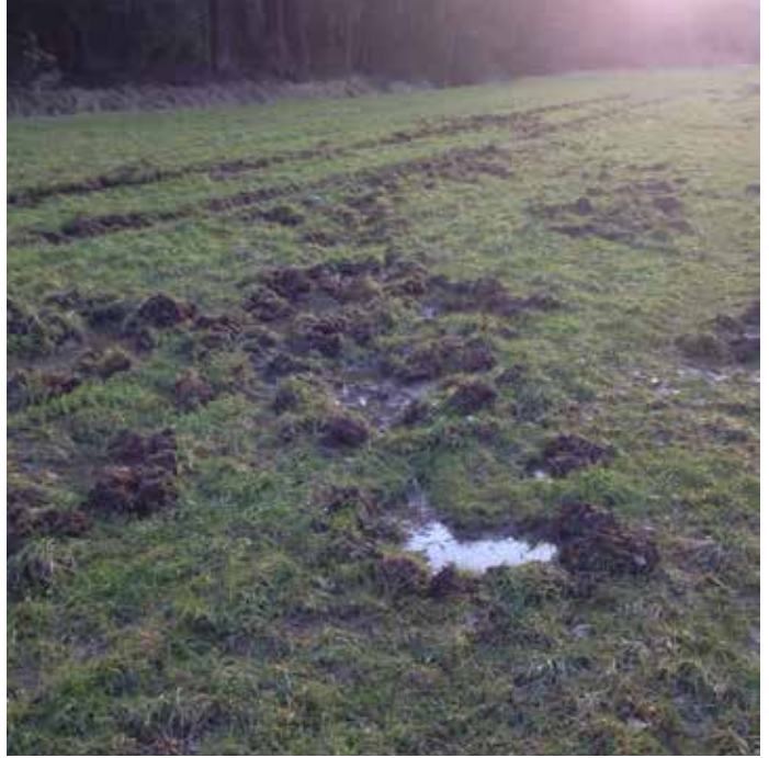
Schäden durch Schwarzwild können sofort erfasst und an den Benachrichtigungskreis weitergegeben werden.